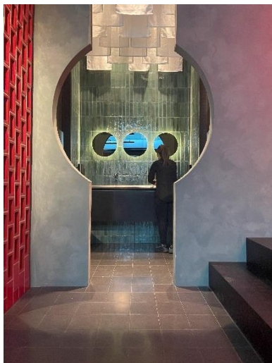
Japanisches Restaurants Okyu, Stuttgart, Designer: Studio Komo, Fertigstellung 2022