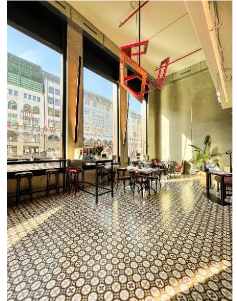
Restaurant Neni, Altes Hafenamt, Hamburg, Fertigstellung 2015 sowie Restaurant Wallters im Bucerius Kunst Forum, Hamburg, Fertigstellung 2020