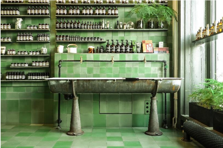
Zementmosaikplatte, Aesop Store, Fertigstellung 2015

Das Schöne leben – dieser Claim sagt alles, denn VIA stellt mit einem hohen ästhetischen Anspruch historische Zementmosaik-, Terrazzo- und Trottoirplatten sowie den fugenlosen VIA Terrazzo her. Letzterer ist ein klassischer und traditioneller Boden, der zementfrei und zu 100% recyclebar ist.