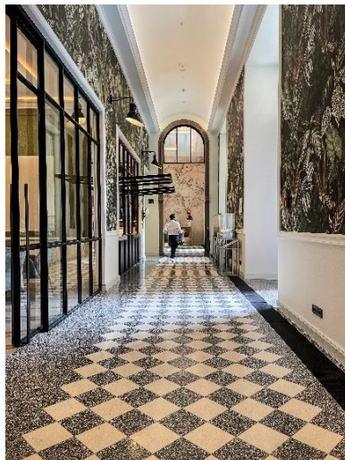
Restaurant WilhelmAlexander im Humboldt Forum, Berlin, Fertigstellung 2022