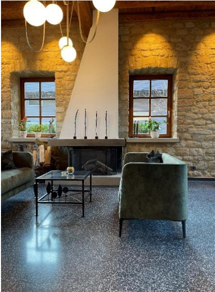
Menschels Vitalresort, Lobby, Meddersheim/Bad Sobernheim, Fertigstellung 2023